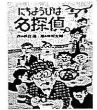
『にちようびは名探偵』 杉山亮 作 偕成社