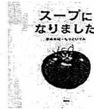
『スープになりました』 彦坂有紀 作 講談社