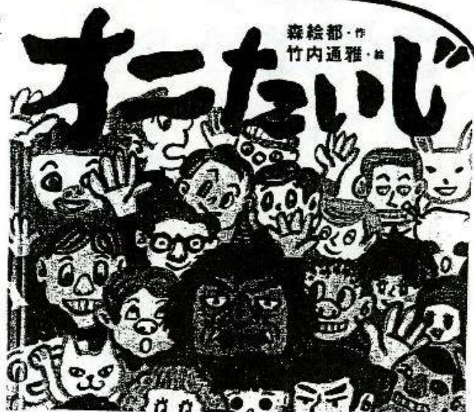
オニたいじ 森 絵都/作 竹内 通雅/絵 (金の星社)