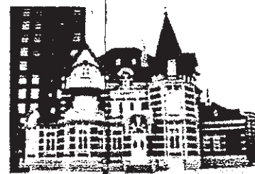
(国際友好記念図書館)

ちなみに、「国際友好記念図書館」は、北九州市と大連市(中国)との友好都市 締結15周年を記念し、大連市にある歴史的建造物を複製建築したものです。 茶色と白の外壁、煙突やドーマー(屋根の小窓)、とんがり屋根が特徴のクラ シカルな建物です。★今も大連市には同じ外観の建物があるんですよ★